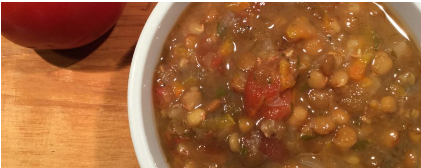
( http://cuisineravecmiceline.com/fr/soupe-aux-lentilles-dans-linstant-pot/ )