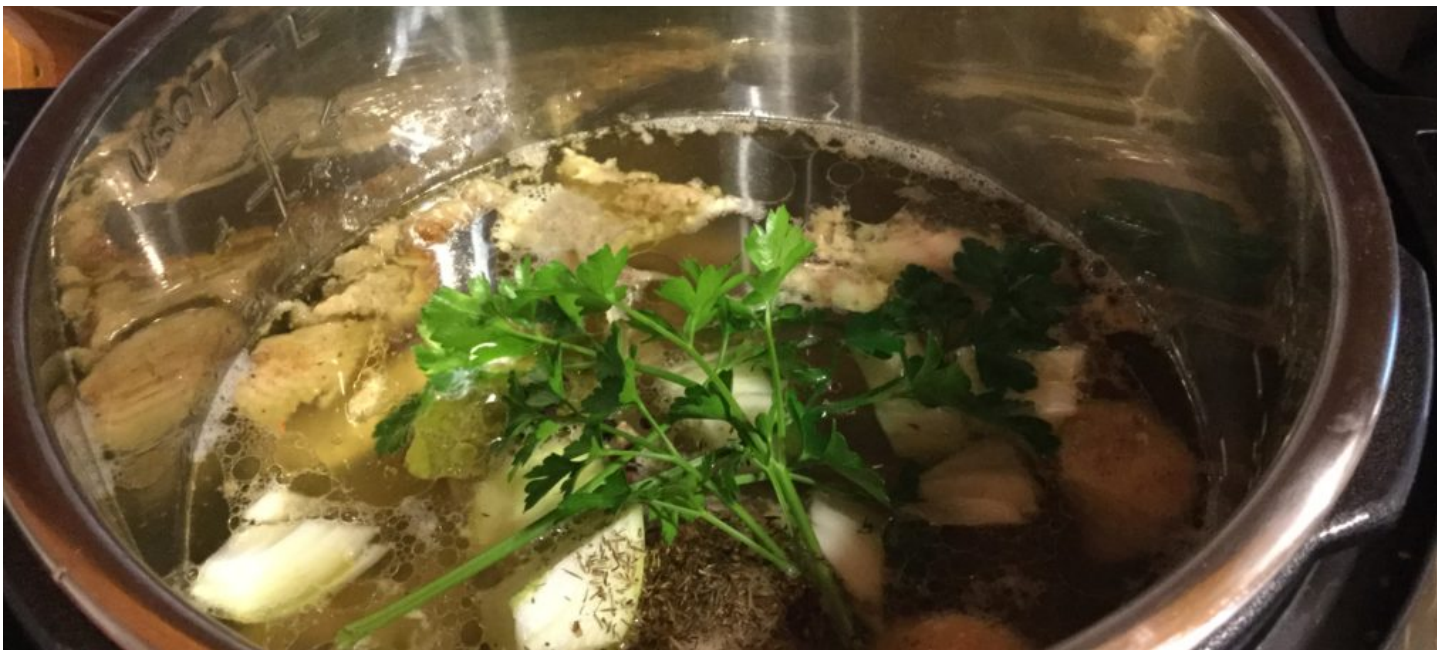
( http://cuisineravecMicheline.com/fr/bouillon-de-poulet-dans-linstant-pot/ )