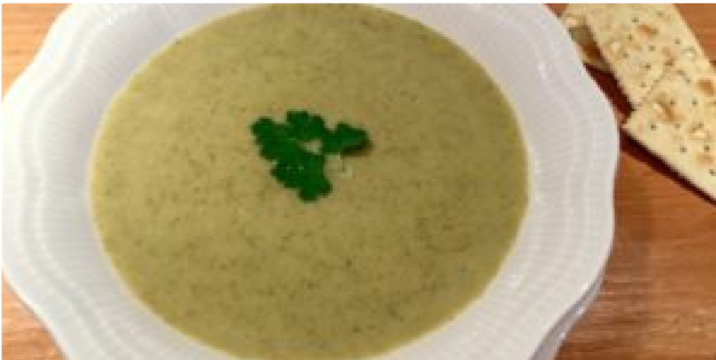
( http://cuisineravecmiceline.com/fr/potage-au-brocoli-dans-linstant-pot/ )

RECETTE » ( HTTP://CUISINERAVECMICHELINE.COM/FR/SOUBE-AUX-LENTILLES-DANS-LINSTANT-POT/ )