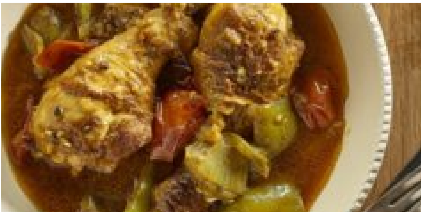
( http://cuisineravecMicheline.com/fr/poulet-au-cari-dans-linstant-pot/ )

RECETTE » ( HTTP://CUISINERAVECMICHELINE.COM/FR/BOUILLON-DE-POULET-DANS-LINSTANT-POT/ )