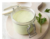
Vinaigrette déesse verte