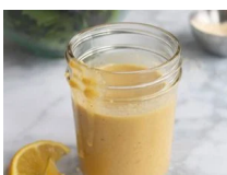
Vinaigrette César keto