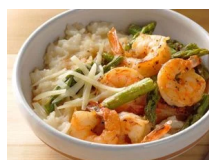
Risotto aux crevettes et aux asperges à l'autocuiseur