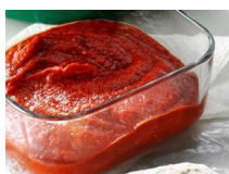
Sauce à pizza savoureuse